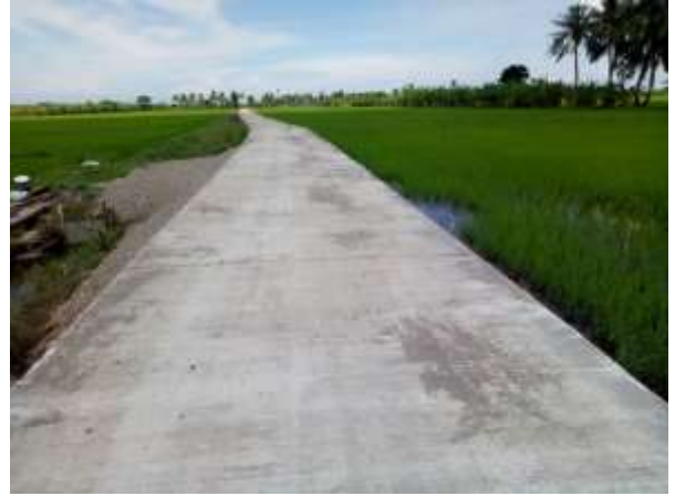
๕. โครงการก่อสร้างถนนคสล.สายคู ๒.๗ (๒๐L-๑R) หมู่ที่ ๓