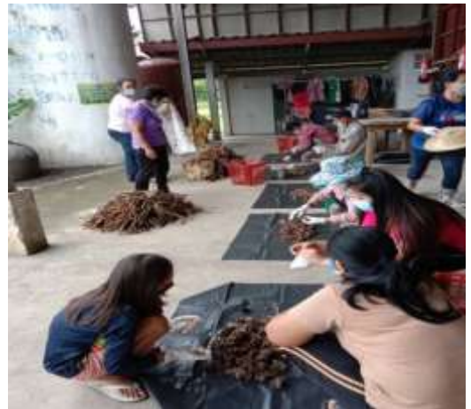
๒๗. โครงการฝึกอบรมอาสาสมัครท้องถิ่นรักษ์โลกอบต.ห้วยโรง