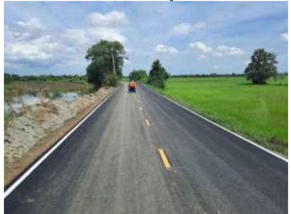
๑๐. โครงการปรับปรุงถนนทางเชื่อม-ทางแยก หมู่ที่ ๒ (จุดที่ ๑) (ห้วยกระต่าย)