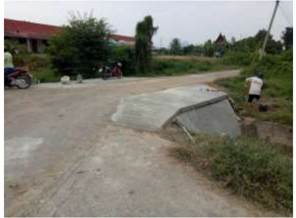
๑๑. โครงการปรับปรุงถนนทางเชื่อม-ทางแยก หมู่ที่ ๒ (จุดที่ ๒) (โคกมะสังข์)