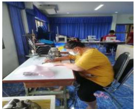
๑๔. โครงการฝึกอบรมอาชีพให้กับประชาชนตำบลห้วยโรง