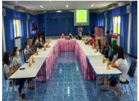
๒๖. โครงการบริหารจัดการขยะแบบบูรณาการตำบลห้วยโรง