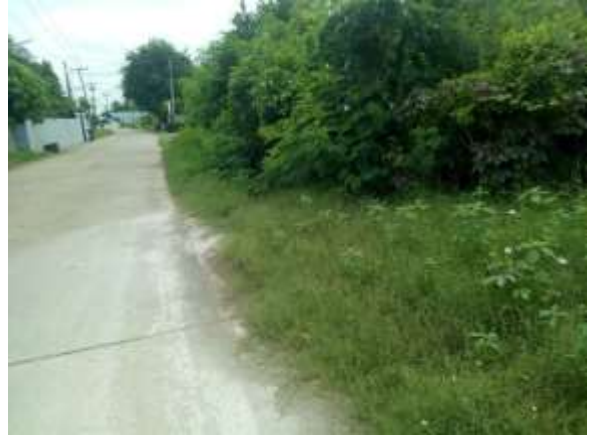
๙. โครงการปรับปรุงถนนลาดยางแอสฟัลท์ติกคอนกรีตสายทางรถไฟ-ไปแพรกหนามแดง หมู่ที่ ๔