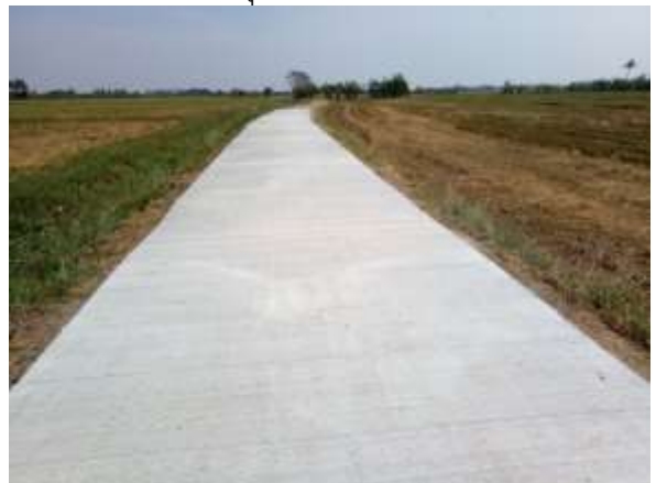
๗. โครงการก่อสร้างถนนคสล. สายริมคลองชลประทานหมู่ที่ ๒ ช่วงที่ ๒